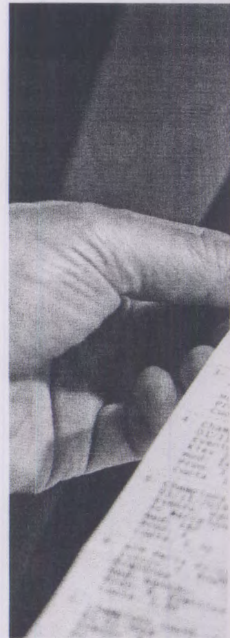
Un usuario jugando en una máquina de apuestas deportivas. BEATRIZ CÍSCAR

Aunque son varios los que aseguran que no se puede establecer un perfil del cliente, hay quien señala a los ciudadanos de nacionalidad china como los mayores usuarios de las 'tragaperras'. «Pueden jugar hasta 300 euros en un día. No paran hasta que no sacan el premio mayor, que, dependien-