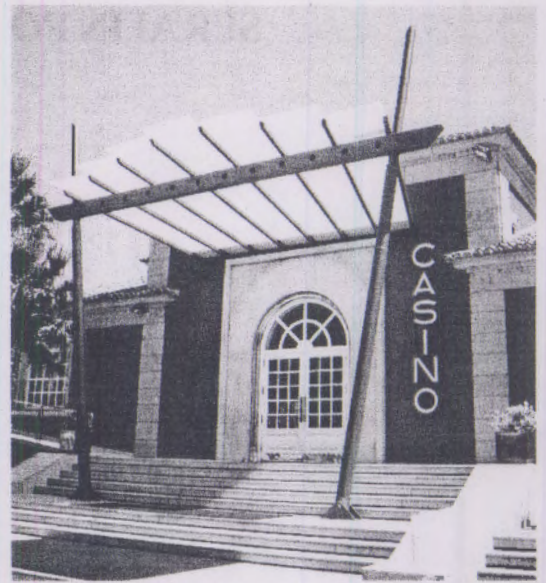
Fachada del Casino de La Toja. DP